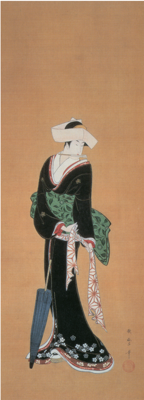
喜多川歌麿「立姿美人図」 個人蔵・東京国立博物館寄託