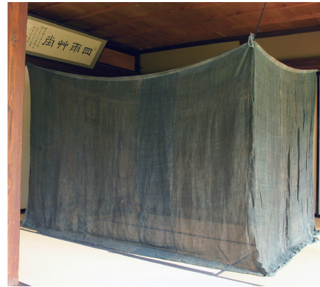
大崎オヨ「蚊帳」 個人蔵