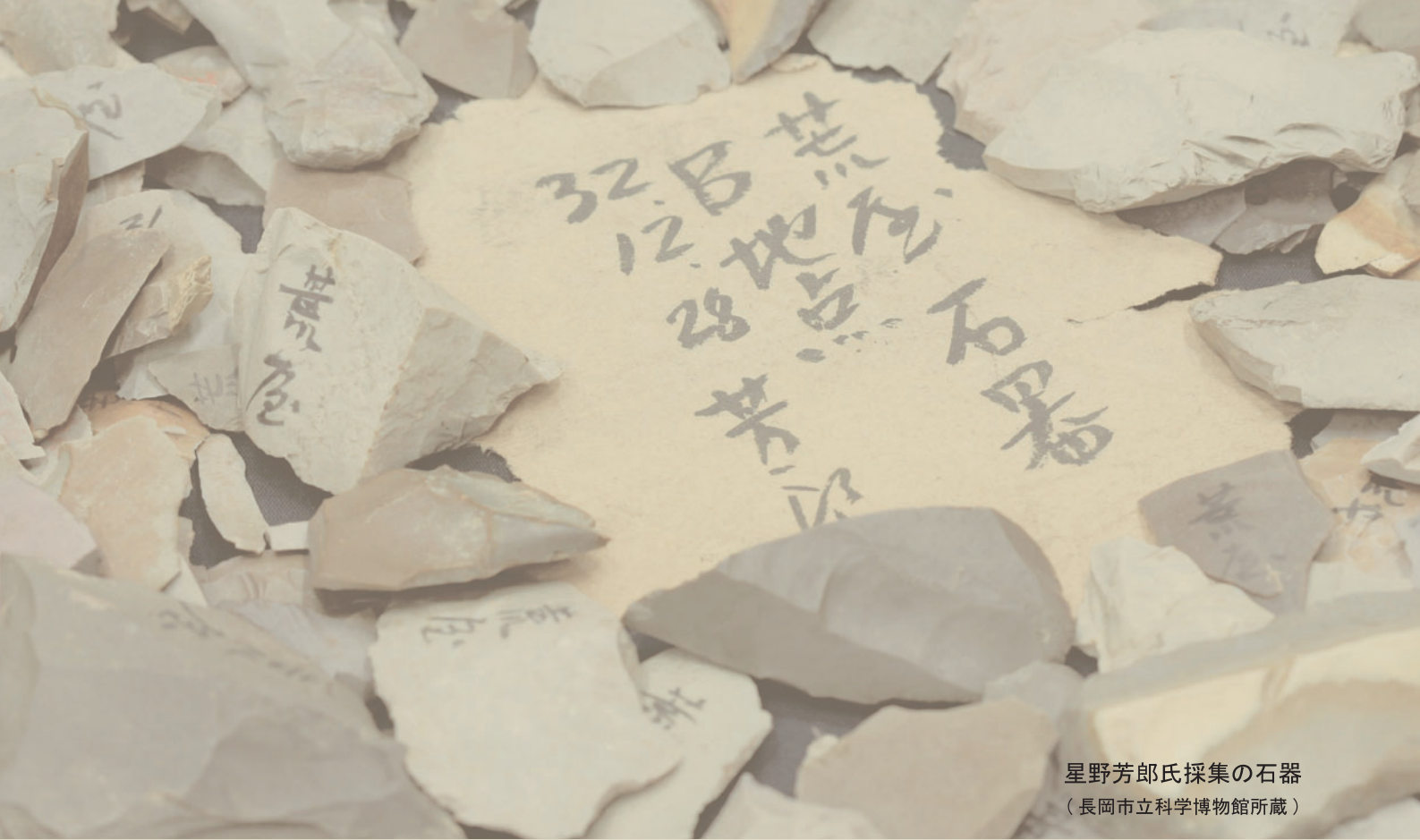
星野芳郎氏採集の石器 (長岡市立科学博物館所蔵)