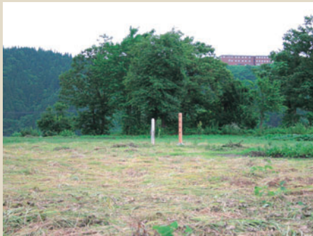
国史跡・荒屋遺跡近景

約1万6千年前の旧石器時代終末、信濃川と魚野川の合流地点に「細石刃」という石器を携えた人びとが現れ、狩りや漁の拠点となるムラがつけられました。