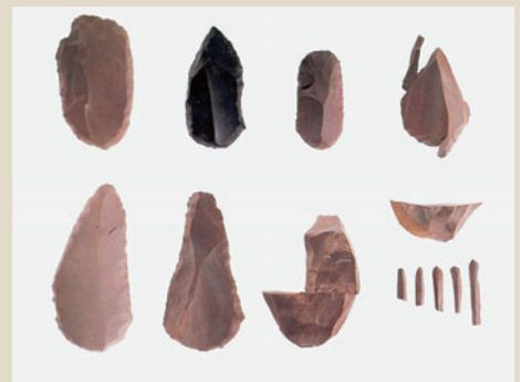
県指定 樽口遺跡出土資料 (村上市教育委員会所蔵)

本展では、川口地域の国指定史跡・荒屋遺跡で発見された特徴的な石器群を中心に、新潟県内の細石刃文化の様相をさぐります。