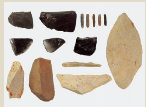
上原E遺跡出土資料 (津南町教育委員会所蔵)

主な展示資料出土遺跡 荒屋遺跡(長岡市)、樽口遺跡・中原野北遺跡(村上市)、中土遺跡(三条市)、田井遺跡(見附市)、月岡遺跡(魚沼市)、上ノ台I遺跡(南魚沼市)、愛宕山遺跡・干溝遺跡(十日町市)、上原E遺跡・正面中島遺跡(津南町)