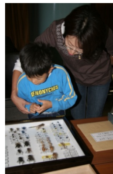
標本を見入る子ども